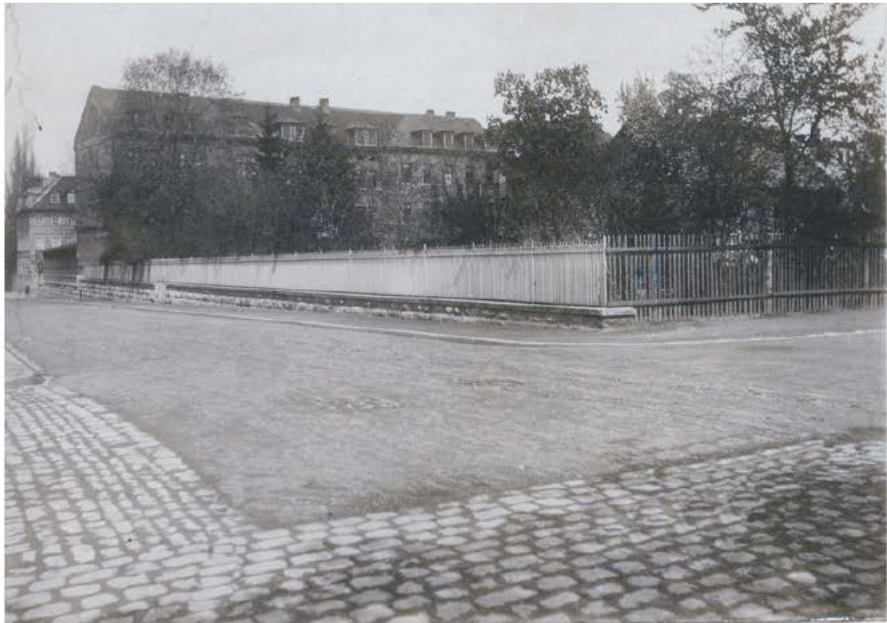
ein altes Bild von der Weimarer Taubstumm- und Blindenanstalt - Besten Dank an Gerhard Sauerbrey

Zusammenschluss der beiden Schwerhörigenbünde Ost und West zum „Deutschen Schwerhörigenbund“ (DSB).