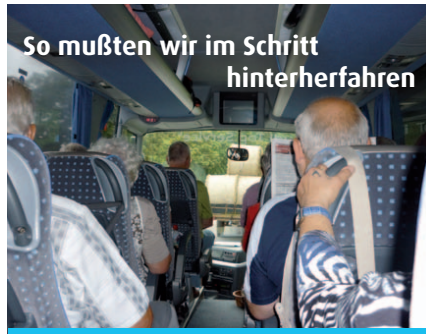
So mußten wir im Schritt hinterherfahren