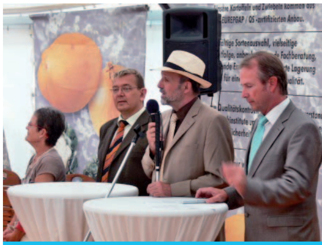
Die feierliche Eröffnung erfolgte durch den Thüringer Innenminister Jörg Geibert.

Im Mittelpunkt der Veranstaltungen standen die Gewerbeausstellung sowie die Beratungsstelle des Blinden-