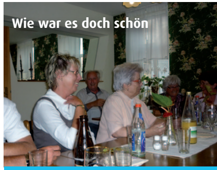
Wie war es doch schön