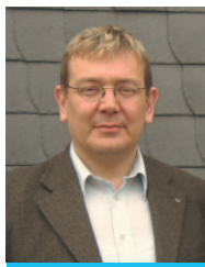
Die Weimarer Selbsthilfegruppe für Hörgeschädigte und Tinnitus