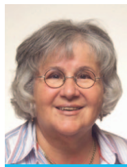
Die Weimarer Selbsthilfegruppe für Hörgeschädigte Senioren

Nicht hören können, heißt die Menschen von den Menschen trennen. (Immanuel Kant)