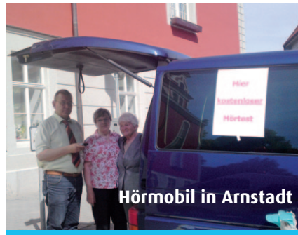
Hörmobil in Arnstadt