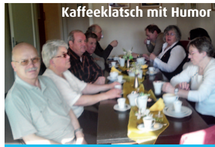
Kaffeeklatsch mit Humor