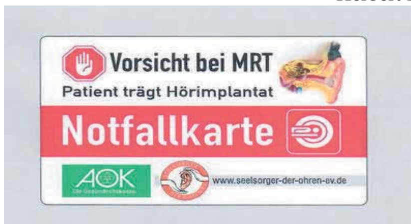
CI-Notfallkarte von "Seelsorger der Ohren e.V."