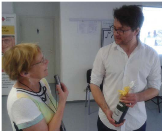
Übergabe an die Klinik in Hannover