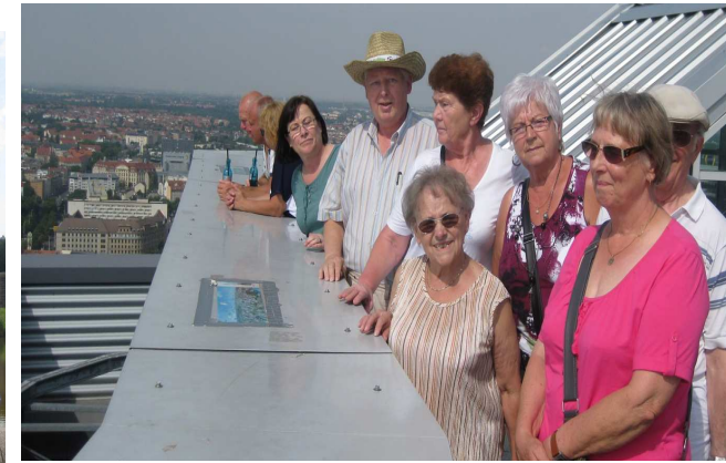
Leipzig - Ein schöner Tag