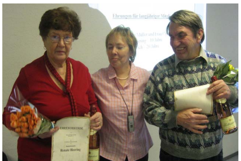
Auszeichnung für langjährige Mitgliedschaft