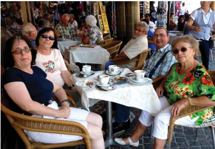
Ein Dankeschön auch an die Max-Zöllner-Stiftung, die diese gemeinsame Bildungsfahrt mit 300€ unterstützte.

Vielleicht gibt es Erfahrungen unter Betroffenen, die helfen können? Denn auch darin besteht der Nutzen von Verein und Selbsthilfegruppen sich auszutauschen, Freude und Leid zu teilen und gemeinsam nach Lösungen zu suchen. Wer also Erfahrungen hat mit CI und Musik, wir würden uns über ein Feedback freuen. Auch wenn den meisten von uns die Schwerhörigkeit und Taubheit bekannt war, so sehen und hören wir Beethoven jetzt mit ganz anderen Augen und Ohren, fand ein Gast zum Abschluss die passenden Worte.